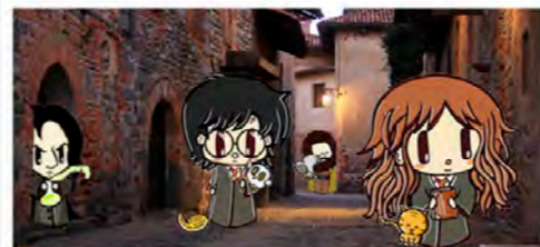
animazione in costume cosplay, giochi a tema